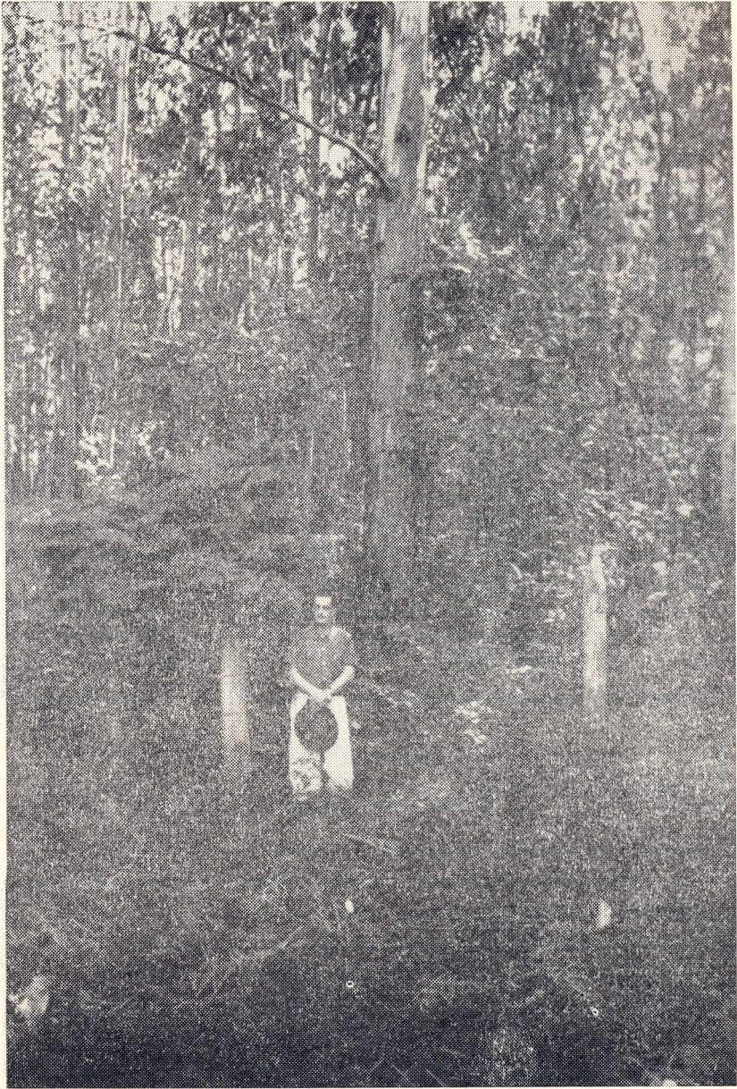
Fig. 156 — Finalmente, o eucalipto TRABUTI das figuras 151 e 153, com 26 anos de idade.