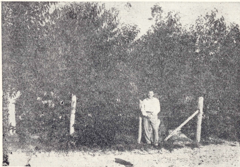
Fig. 147 — HÔRTO DE BOA VISTA

No Hôrto de Boa Vista, num corte feito para fornecimento de lenha à própria Companhia, E. tereticornis de 9 anos apresentavam uma brotação de 95,4%, poucos meses depois de derrubados. Num outro talhão, plantado em 1.910, abatido pela primeira vez em 1.916 e que sofreu o segundo corte em 1.927, brotaram 97,4% das árvores existentes, na sua grande maioria E. robusta , botryoides e tereticornis