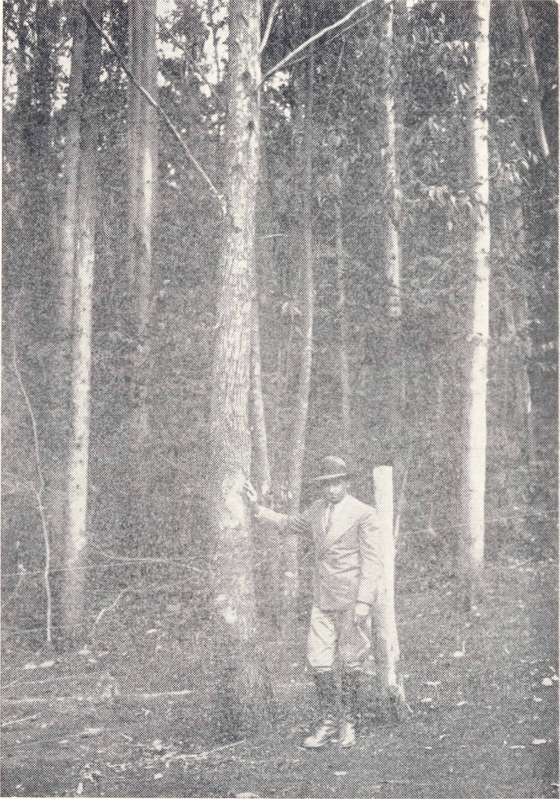
Fig. 153 — O mesmo eucalipto TRABUTI, da figura 151, com 12 anos de idade.