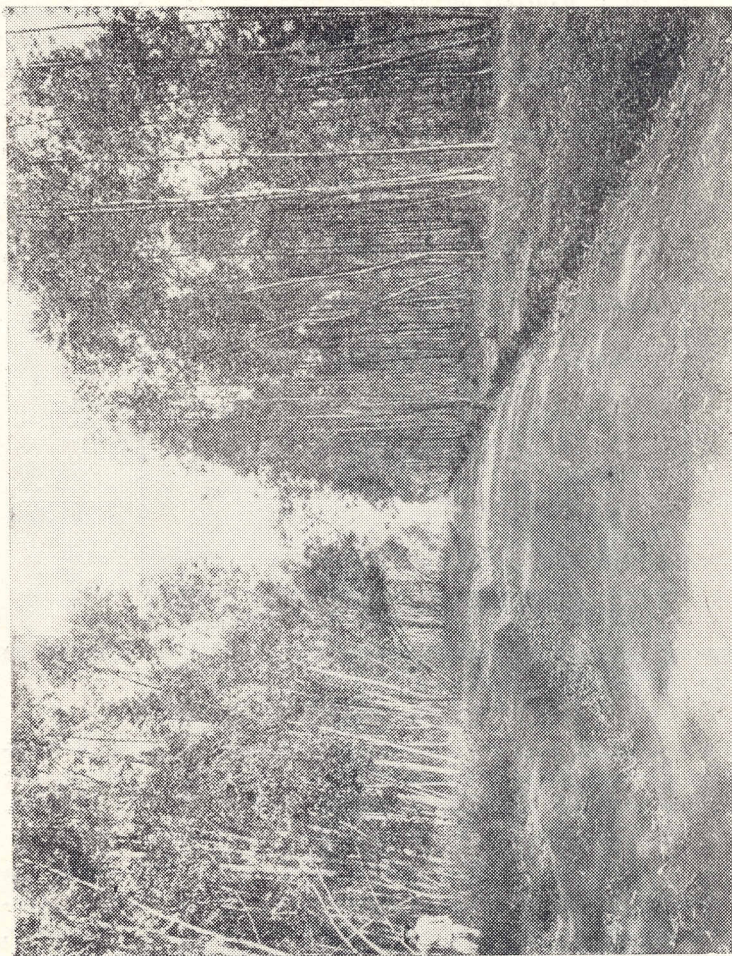
Fig. 149 — HÓRTO DE GUARANI Regeneração de eucaliptos em terra muito pobre, 6 anos após o primeiro corte. À esquerda — E. TERETICORNIS e à direita — E. ALBA