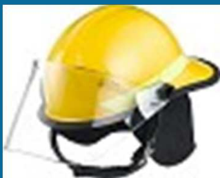
Protetor de Nuca