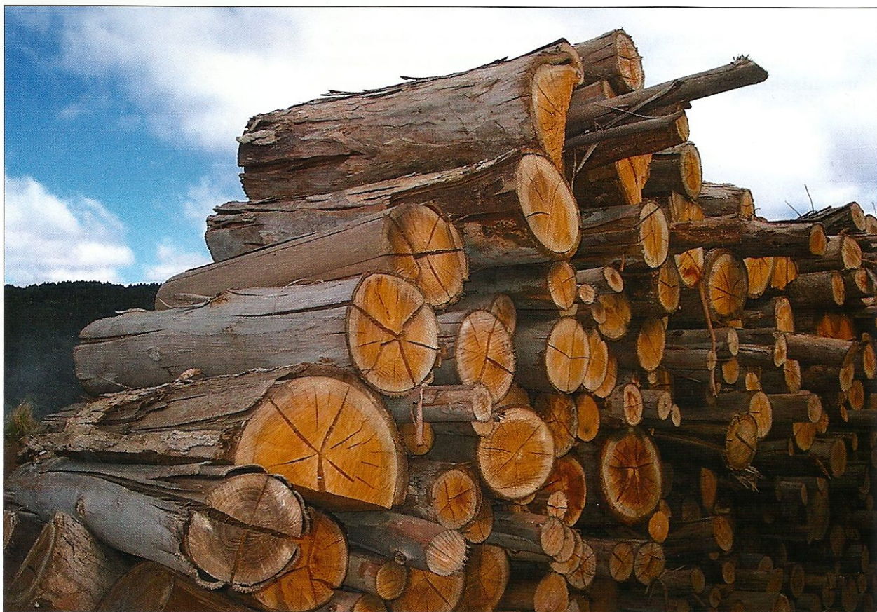
É preciso usar melhor a madeira produzida pelas florestas plantadas

Não podemos esquecer o grande perigo da desilusão futura desse produtor rural: plantios destruídos por formigas ou