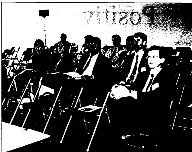
Asistentes a las charlas técnicas.

"Para poder analizar cómo hemos visto estas Jornadas y la Expocelpa'95, es necesario comentar los enormes cambios que se han tenido en el campo tecnológico en la producción de celulosa y papel. Cuando se iniciaron estas Jornadas, en