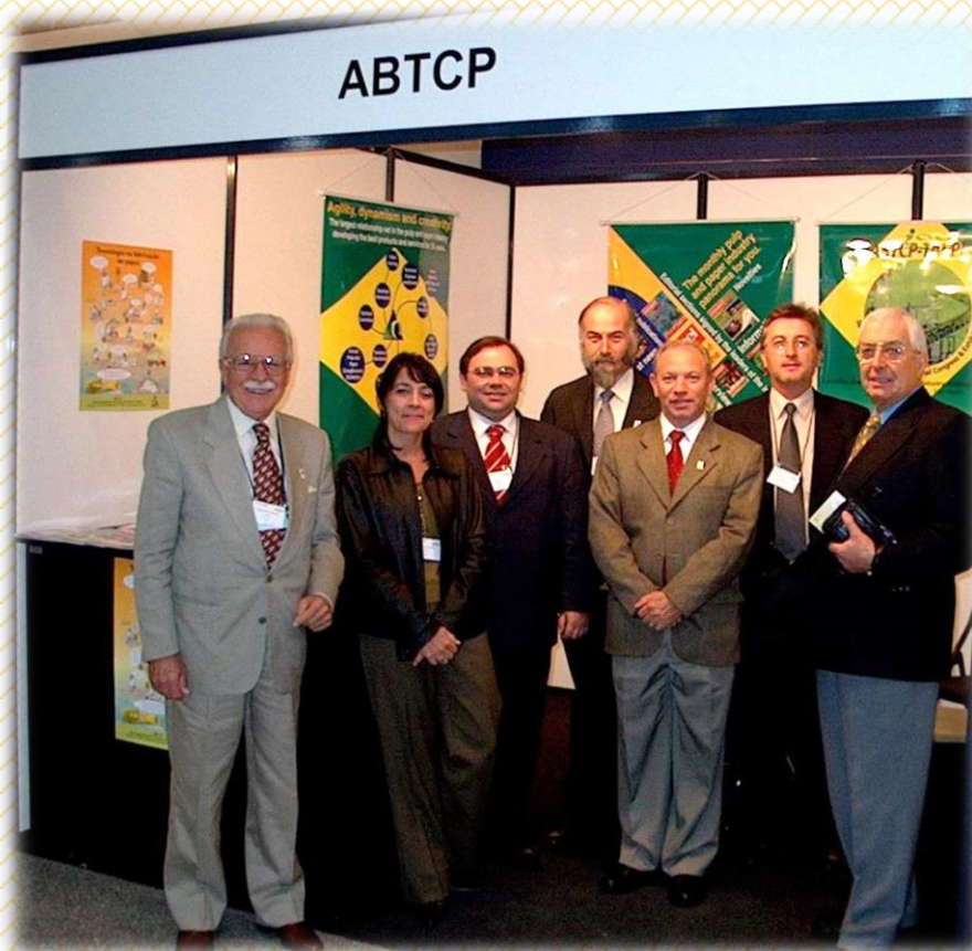
ABTCP em TECNICELPA – evento TECNICELPA & EUCEPA em Lisboa – 2003

http://www.celso-foelkel.com.br/artigos/outros/Pasta_Papel_Entrevistas_2001.pdf