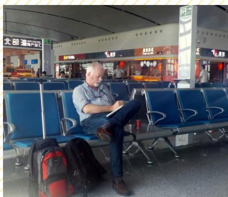
Na China, visitando clientes e participando de conferências sobre resinas de Pinus

consultor de um projeto desafiador para obtenção e produção de produtos da oleoresina do Pinus .