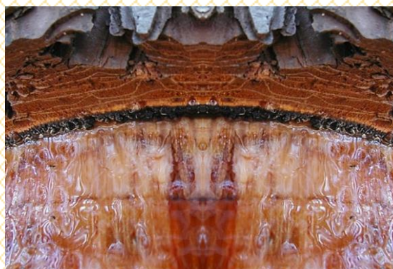
Imagem adaptada a partir de material publicado de A. Cunningham