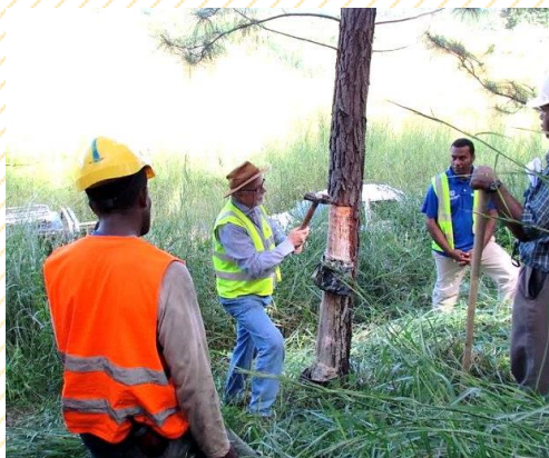
Treinamento de pessoal para fazer a resinagem de Pinus - em Fiji, 2013

Em 2003, Alex formou sua própria empresa (Ar Eldorado Ltda.) de consultoria e de produção de pastas estimulantes para a resinagem das árvores, com o que conseguiu promover o aumento da produção de resinas dos seus clientes, inicialmente na região sul do estado de São Paulo e atualmente em inúmeros países.