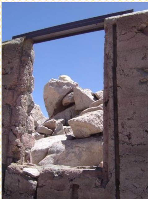
Pedreiras, barreiras e desafios constantes para o Pinus e para o setor de base florestal...