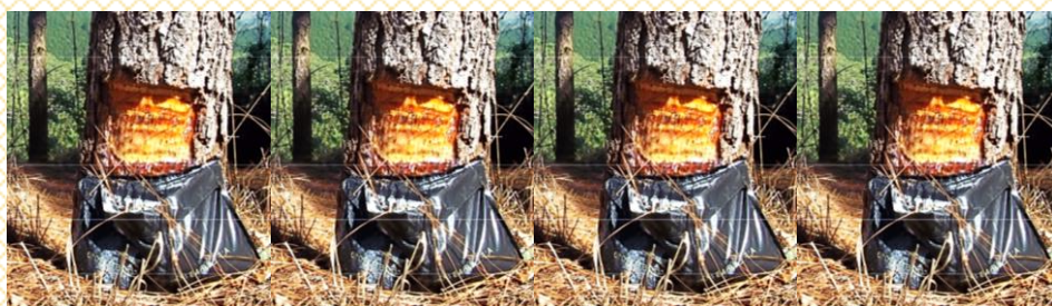
Mas isso só nos estimula... Afinal, as conquistas têm sido enormes no setor florestal de extração de resinas e setor químico de industrialização de produtos derivados da resina do Pinus