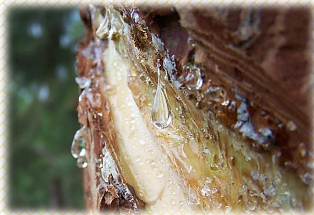
Produção de resina por Pinus – Fonte da foto: Alejandro Cunningham