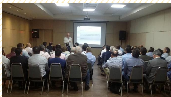
Encontro Pine Chemicals em São Paulo - 2016